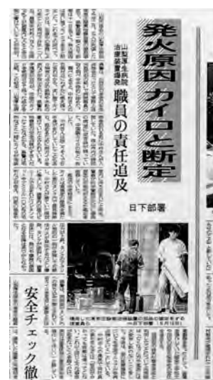
図2：1996年当時の事故を報道した新聞