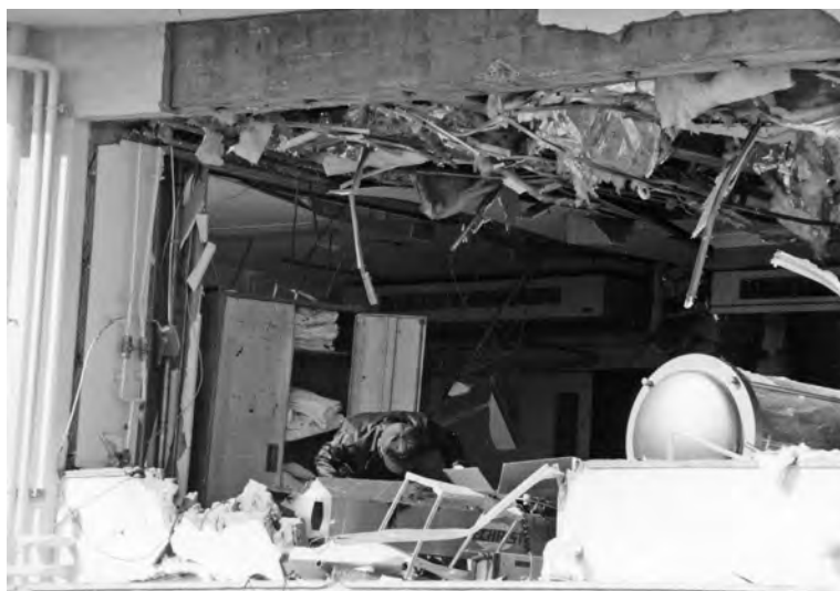
図1：山梨県で発生した高気圧酸素治療装置火災爆発事故(1996年)

高気圧酸素治療装置を操作する臨床工学技士の養成校での教育は、座学および実習施設の設備に高気圧酸素治療装置があることとなっていますが、現状で