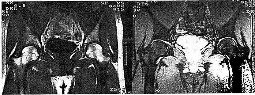
図2 I型減圧症発症者の2年後(1997年2月)の両股関節骨頭部のMRI像

飽和潜水と減圧症発症例で血液性状、血液生化学の変化との関連が主に動物実験の結果より報告 7)~9) されている。また減圧症のgradeによって白血球数、LDH、GOT、GPTなどが著しく上昇すると報告されている 10)11) 。本症例ではGOT、GPT、LDH、血糖値、白血球数なども有意な変化を示さずこの面からも軽度の減圧症症例であることが示唆された。